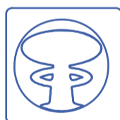
Darik's Boot and Nuke (DBAN)