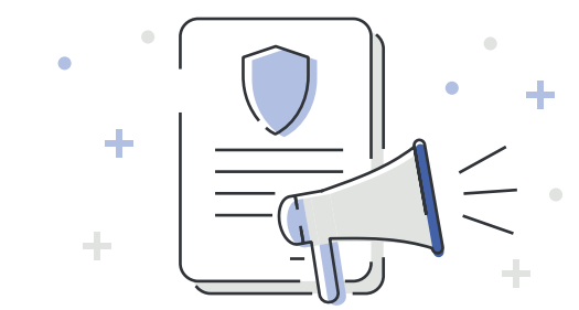
Erakundearen zibersegurtasun-egoeraren eta esposizio mailaren berri ematea zuzendaritza-talde eta kontseiluei.