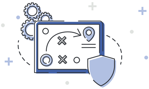
Zibersegurtasuneko estrategiak sortzea, erakundearen epe labur, ertain eta luzeko helburuekin bat datozenak.